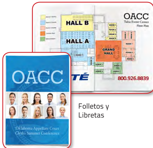
Folletos y Libretas